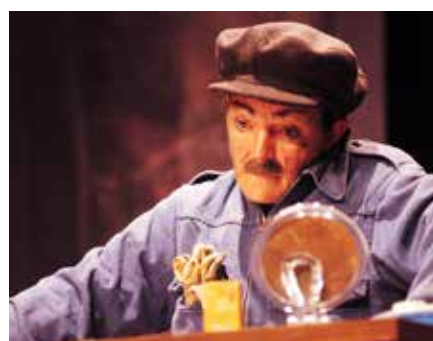
MITT LIV SOM MANN

– sjølbiografisk om oppvekst og skuespillerliv Première 05.01.2008, Porsgrunn