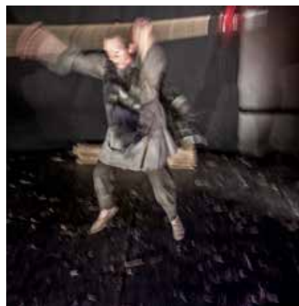
FLYKTINGENS 7 SONGAR