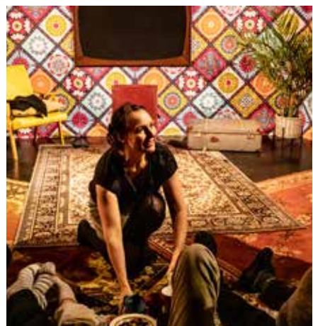
DA NEW AGE KOM TIL BYGDA