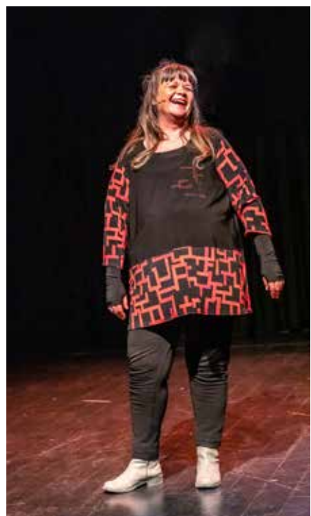
GI MEG EN KLOVN MENS JEG LEVER

GI MEG EN KLOVN MENS JEG LEVER – sjølbioGRAFisk om å leve med en kreftdiagnose. Koproduisert med Gunn Inger Aareskiold. Premiére 24.04.2019, Friteatret, Porsgrunn