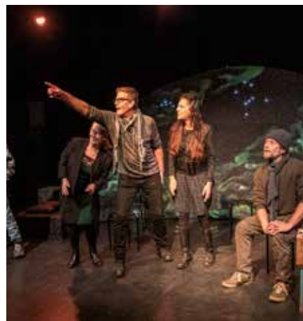
MIRAKELET I RØNNA

- et litt annerledes juleeventyr Ko-produsert med Tiljateateret Première 2020