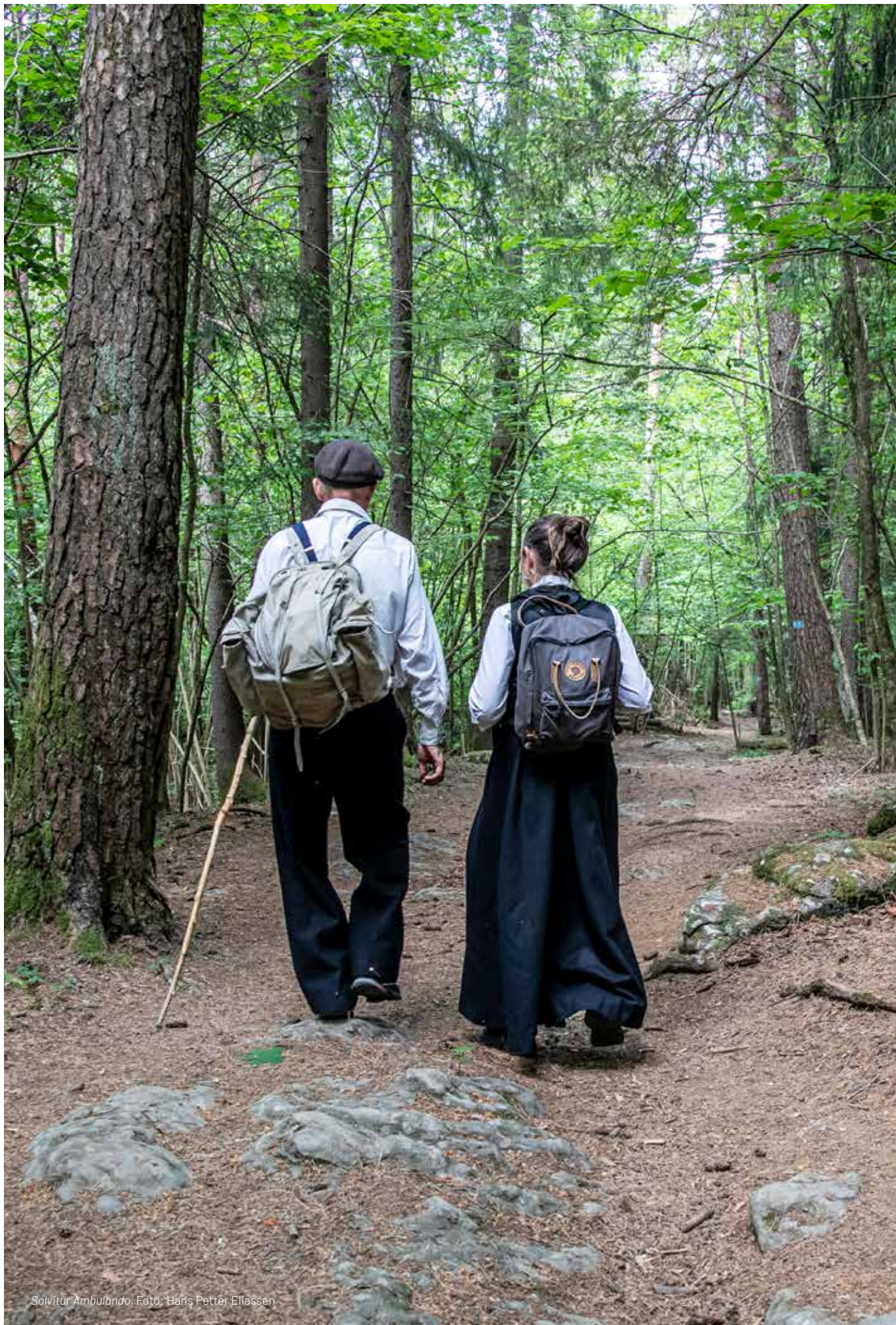
Solvitur Ambulando.