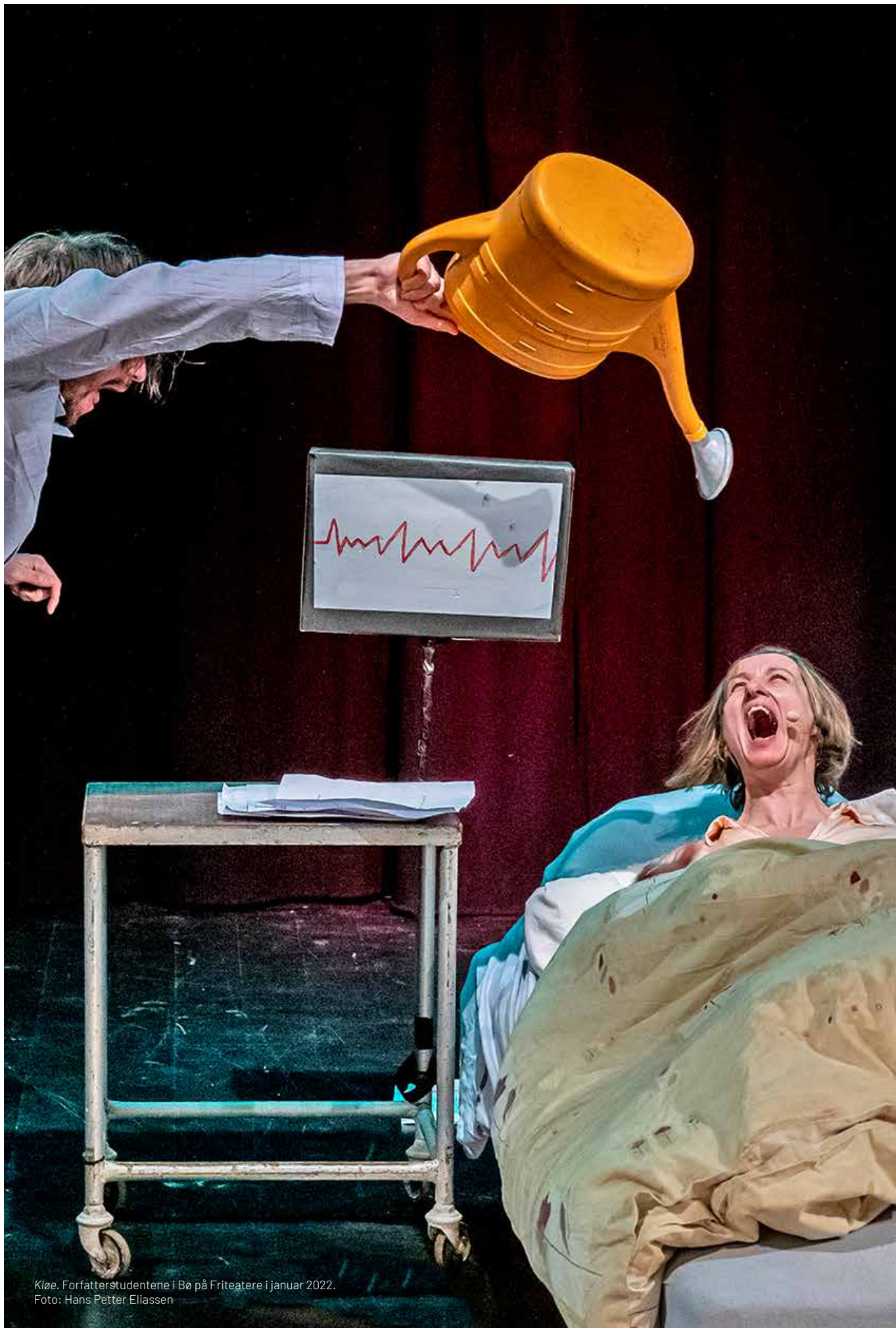
Kløe. Forfatterstudentene i Bø på Friteatere i januar 2022.