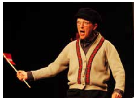
MITT LIV SOM MANN

- sjølbiografisk om levd liv og arbeid med karakterer Première 2008