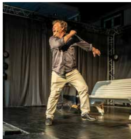
AAGE OG EG

- siste forestilling i trilogien med Voff! Art og Tone! Art Ko-produsert med Saglicco Ensemble Première 2014