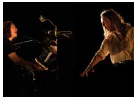
INGEN DOKTOR FOR DE DØDE