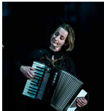
SANGEN BLIR BORTE

- om å forholde seg til demens i nære relasjoner Ko-produsert med Nina Ossavy Première 2021